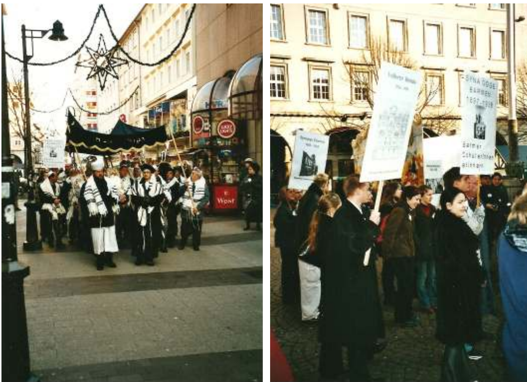
Die Thora-Rollen werden durch die Innenstadt Wuppertal-Barmens getragen. Dahinter die Schülergruppen der „Sternfahrt“.

In Wuppertal-Barmen haben die beteiligten Schülergruppen die Prozession der Gemeinde mit den Thora-Rollen durch die Innenstadt vom Rathaus Barmen bis zur Bergischen Synagoge begleitet.